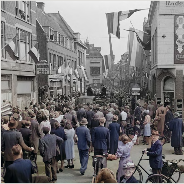
Adolf Hitler wordt rijkskanselier van Duitsland.